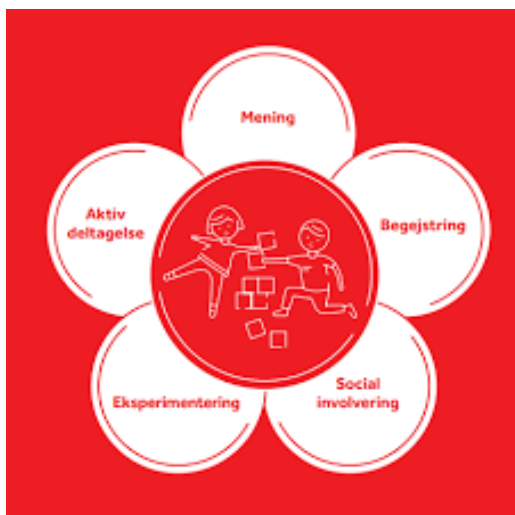
Legens kendetegn – The LEGO Foundation

Kendetegn for legende oplevelser – som er til stede i varierende grad, når børn indgår i lærende legeaktiviteter, og alle fem er ikke nødvendige hele tiden.